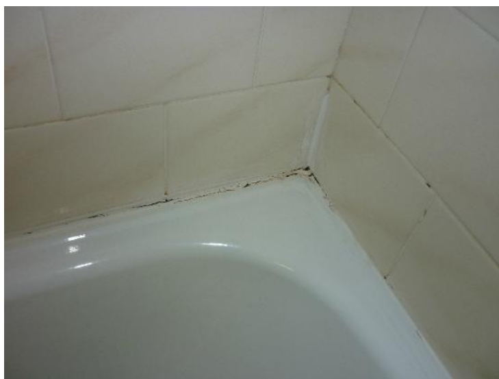
Joint de baignoire complètement ouvert

Le mauvais entretien des joints est la première cause d'infiltration en copropriété. Il est primordial de vérifier leur bonne tenue. Parfois le joint peut sembler étanche mais si la stabilité de la baignoire ou du tub de douche n'est pas parfaite, les lèvres peuvent s'ouvrir légèrement avec le poids d'une personne. Avec le temps, le silicone sèche et les infiltrations commencent. Nous recommandons un remplacement de ce joint tous les deux ans environ. L'opération est très simple à réaliser, il existe des pistolets à usage unique dans les magasins de bricolage.